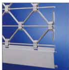
Reja enrollable en forma de rombo (aluminio).