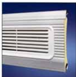
ThermoTeck con reja de ventilación.