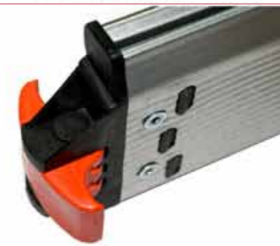
Gancho contra vientos