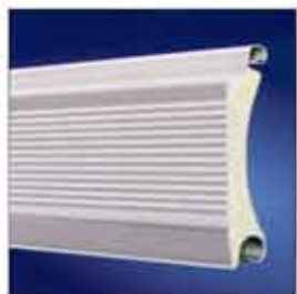
ThermoTeck con capa protectora o revestimiento de cinta bilateral.

Perfiles con aislamiento térmico efectivo y resistencia a elevadas cargas por el viento.