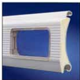
ThermoTeck con acristalamiento.