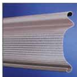
Perfil para puerta enrollable con sección de ventilación 30%.