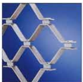
Reja enrollable en forma de panel en aluminio, acero y acero inoxidable.