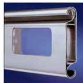
Aluminio con acristalamiento.